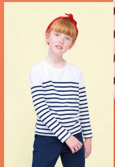
MATELOT LSL KIDS 03101