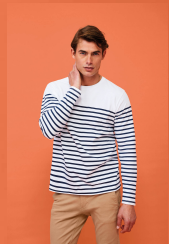
MATELOT LSL MEN 03099