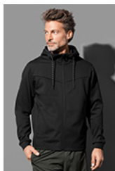
ST5840 Recycled Scuba Jacket