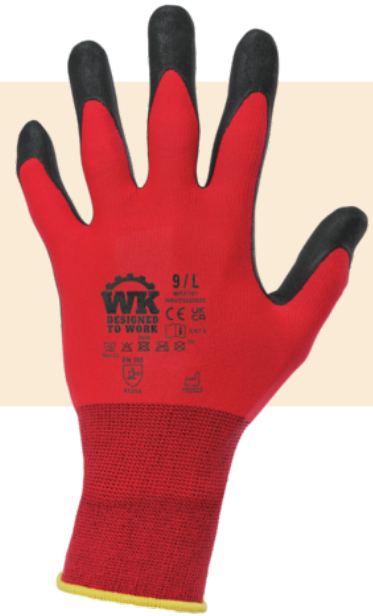
Tableau équivalence des tailles par pays en dernière page.