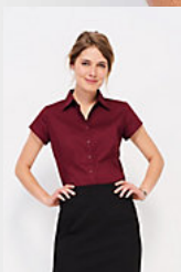
SOL'S EXCESS 17020