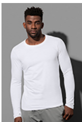
ST9620 Clive Long Sleeve