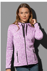
ST5950 Knit Fleece Jacket